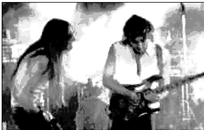
Gli Asilo Republic domani sera al circolo Fuori Orario